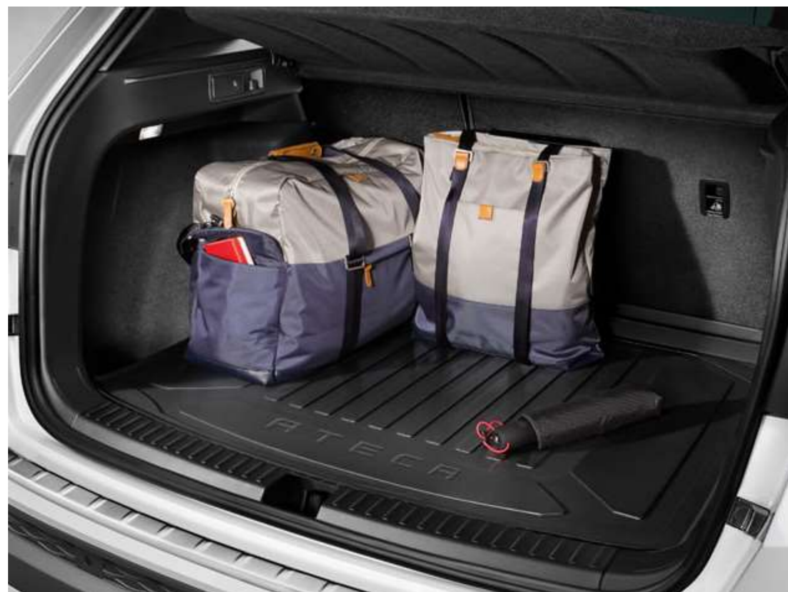
MATA BAGAŻNIKA 299 zł