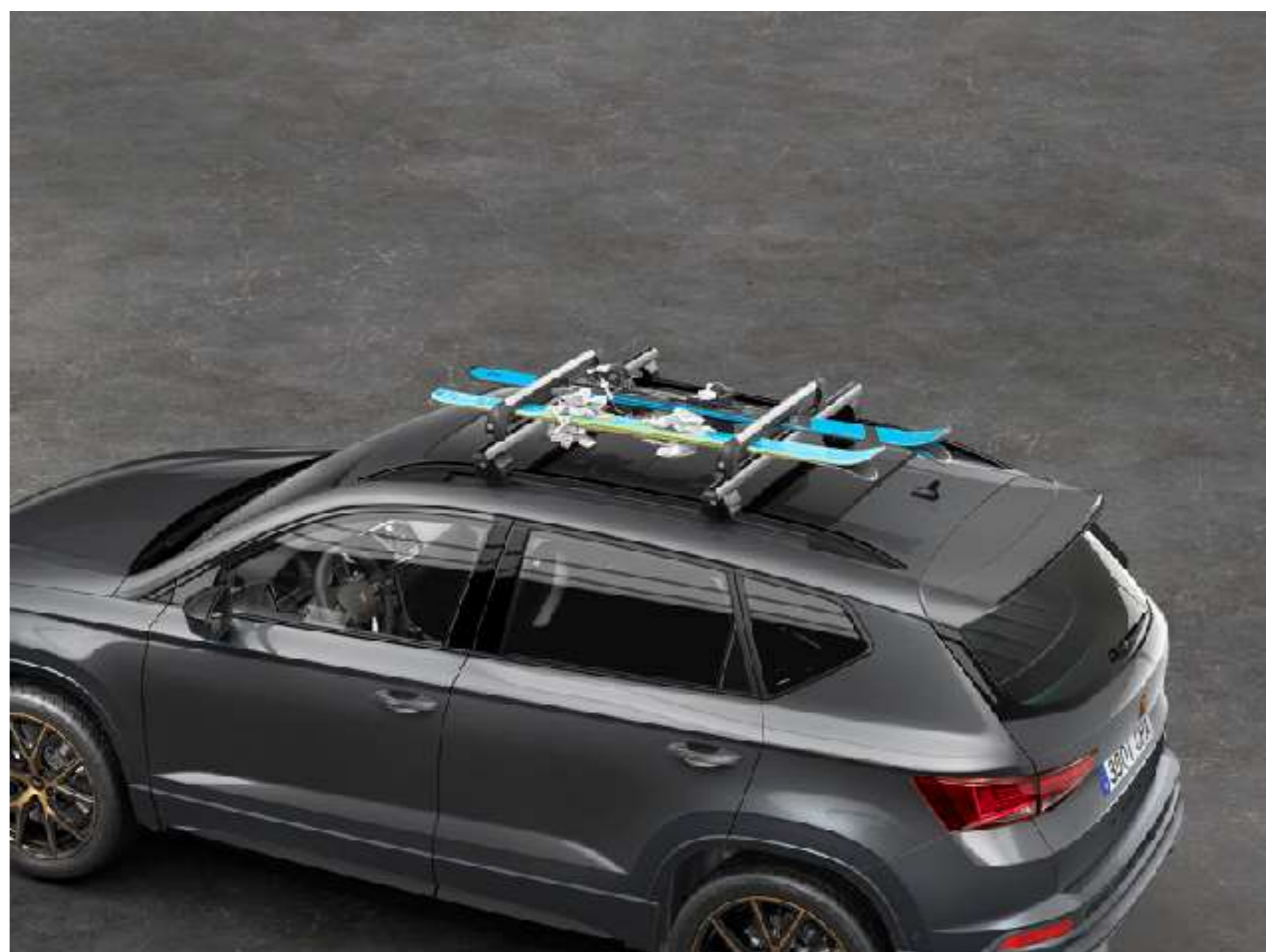
UCHWYT NA NARTY 799 zł