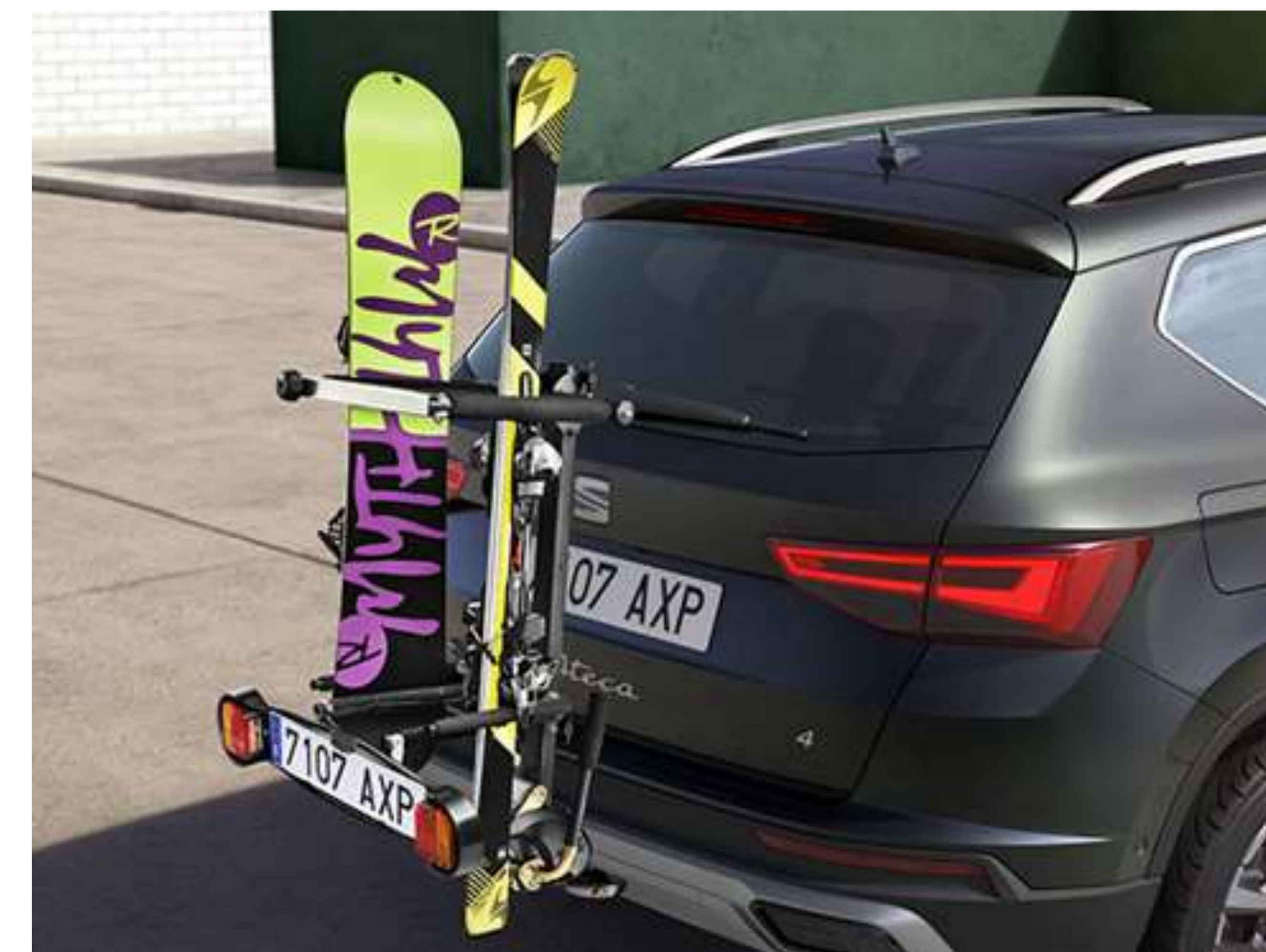
UCHWYT NA NARTY NA HAK 2 199zł