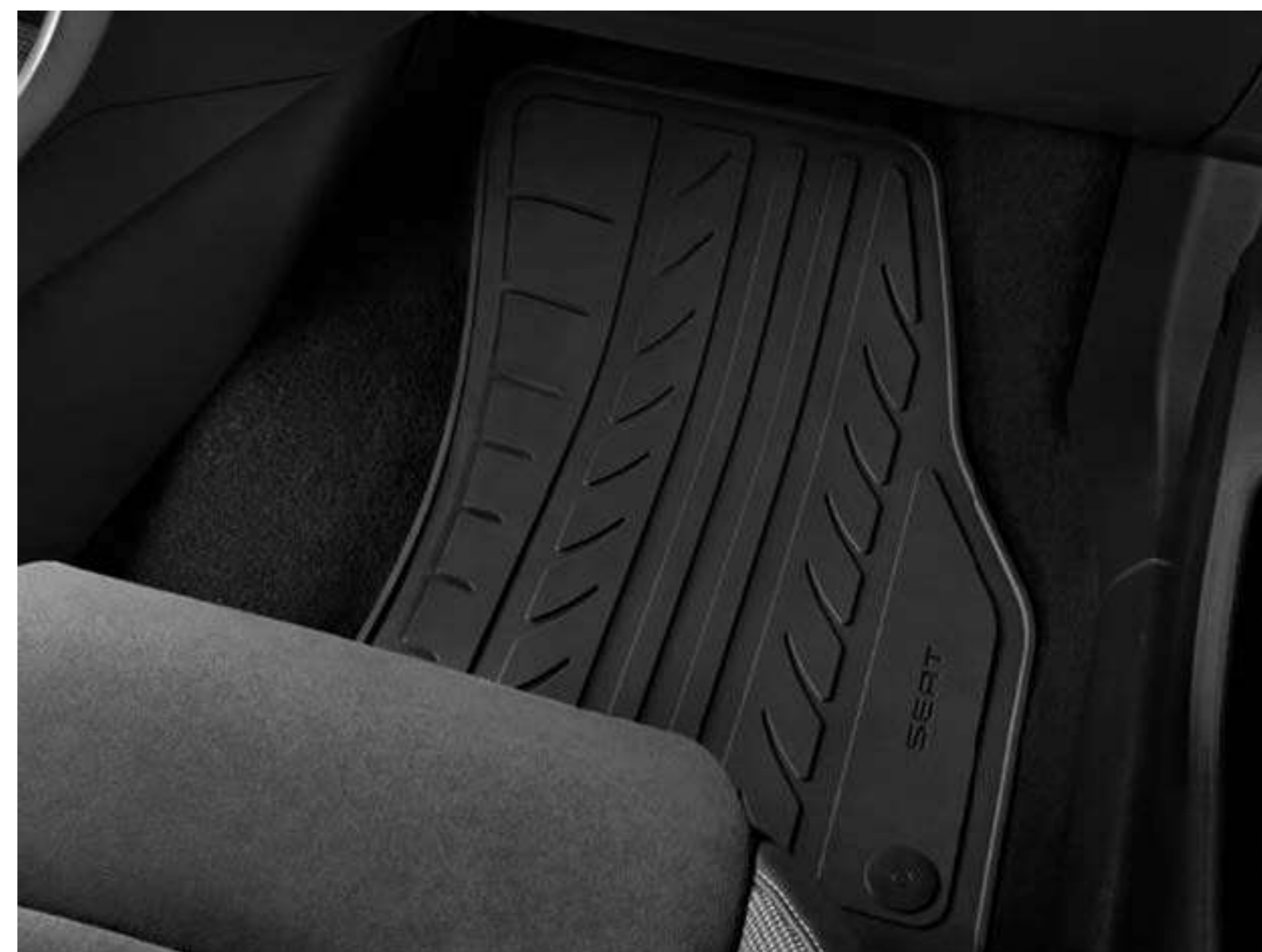
DYWANIKI GUMOWE 299 zł