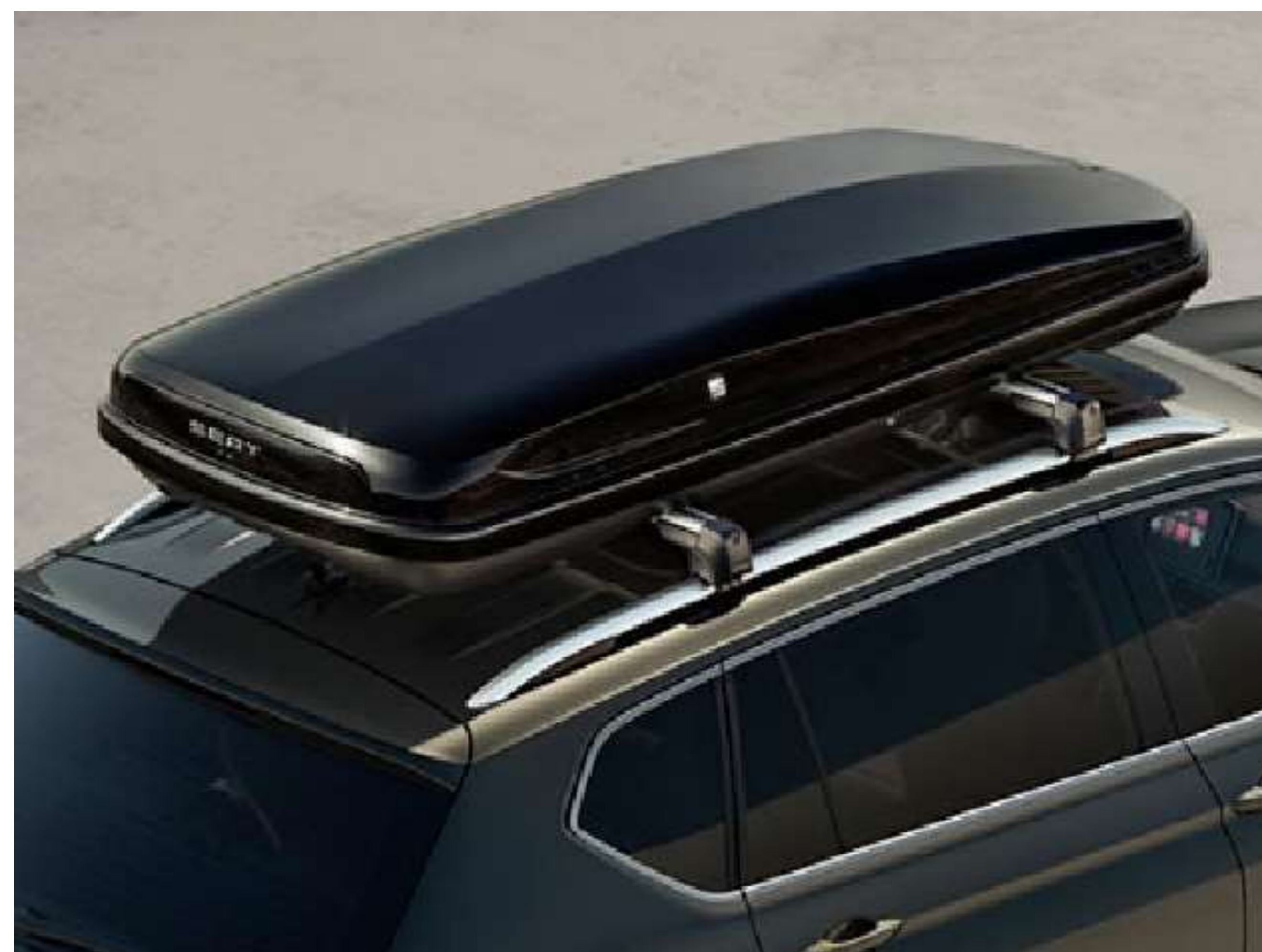
BOX DACHOWY 460L 3 399 zł