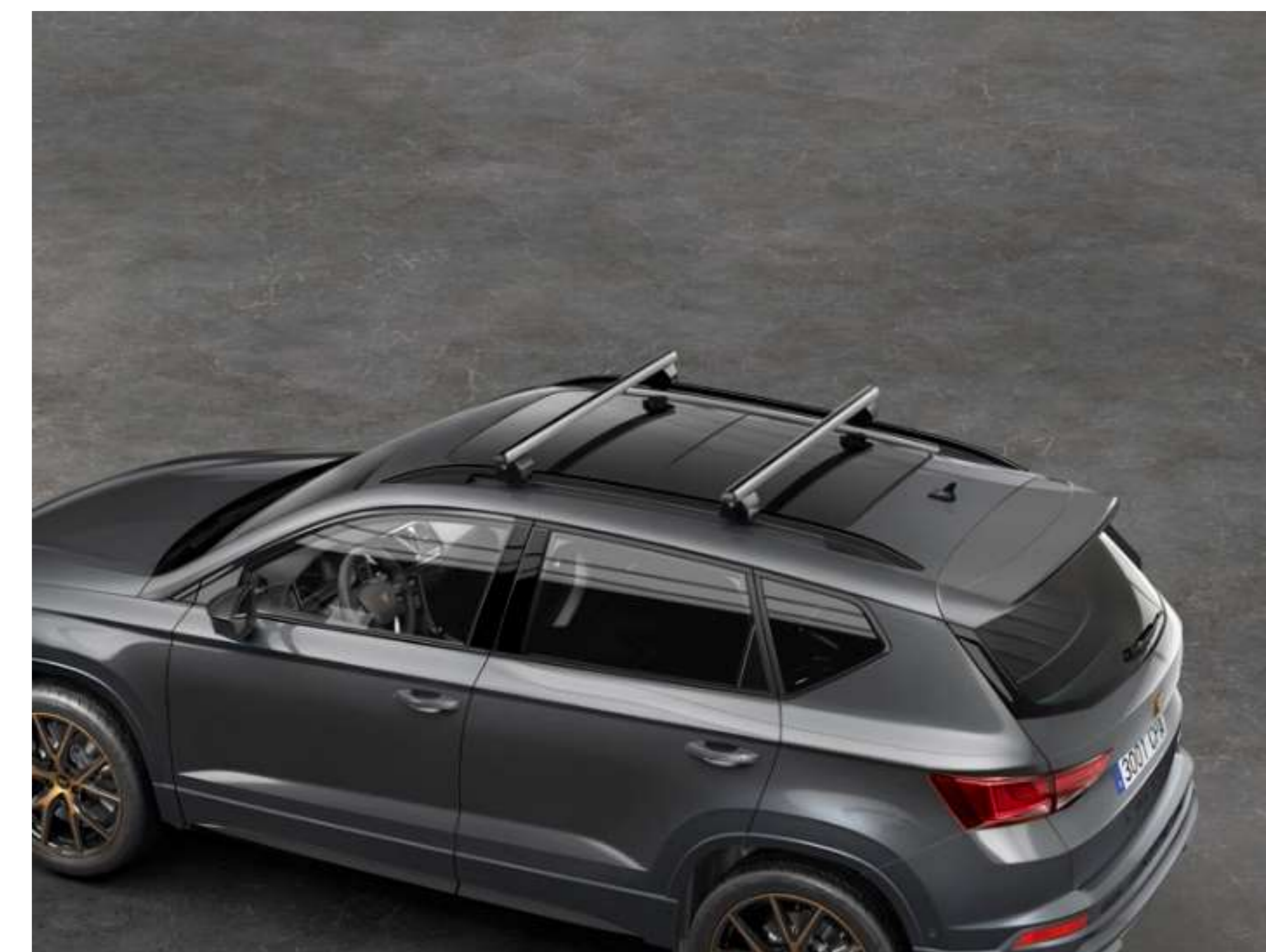
BELKI DACHOWE 1 099 zł